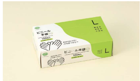
ビニール手袋L T-004 ポリ塩化ビニール/ナチュラル