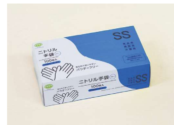
ニトリル手袋 60μ SS T-005 ニトリルゴム/ブルー