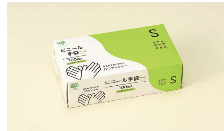
ビニール手袋S T-008 ポリ塩化ビニール/ナチュラル