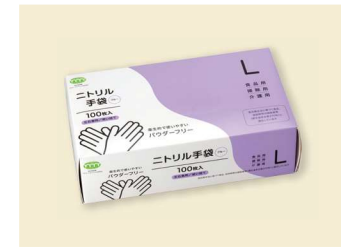
ニトリル手袋 70μ L T-042 ニトリルゴム/ブルー