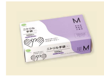
ニトリル手袋 70μ M T-041 ニトリルゴム/ブルー