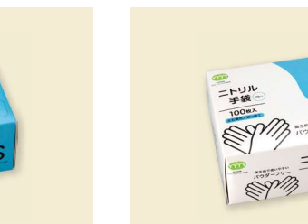
ビニール手袋 80μ M T-031 ニトリルゴム/ブルー