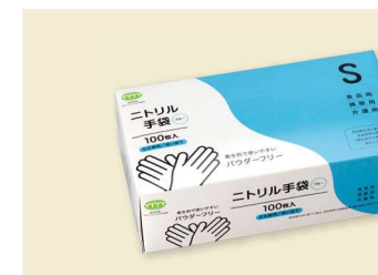
ビニール手袋 80μ S T-036 ニトリルゴム/ブルー