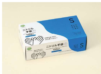
ニトリル手袋 60μ S T-006 ニトリルゴム/ブルー