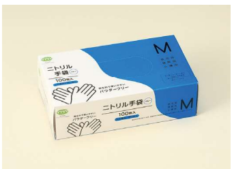
ニトリル手袋 60μ M T-001 ニトリルゴム/ブルー