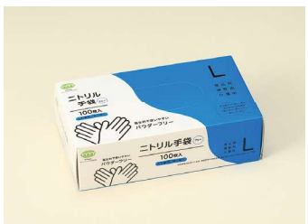
ニトリル手袋 60μ L T-002 ニトリルゴム/ブルー