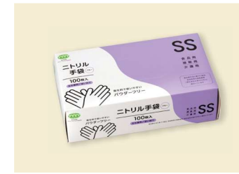
ニトリル手袋 70μ SS T-045 ニトリルゴム/ブルー