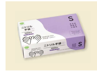
ニトリル手袋 70μ S T-046 ニトリルゴム/ブルー