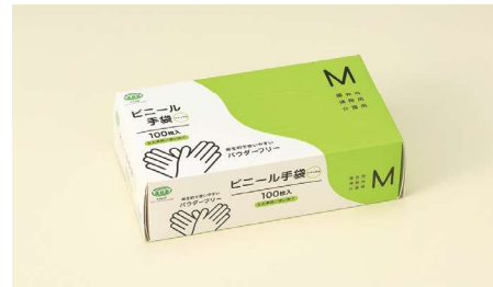
ビニール手袋M T-003 ポリ塩化ビニール/ナチュラル